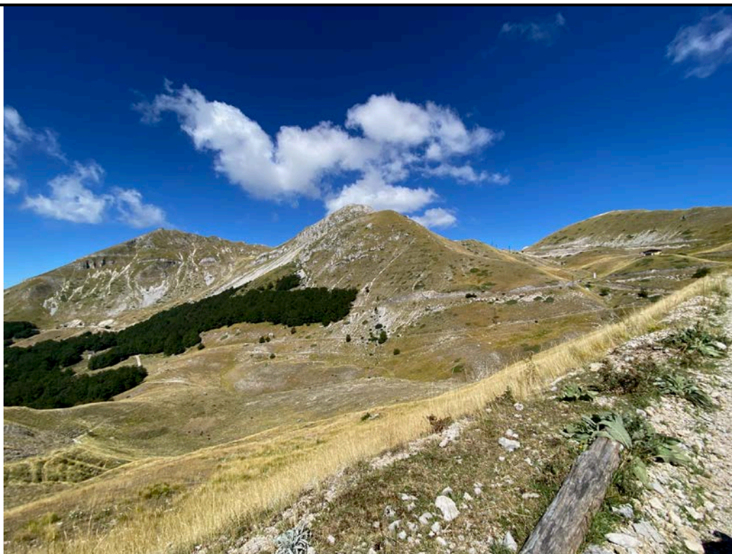
Monte Terminillo e Rifugio Sebastiani