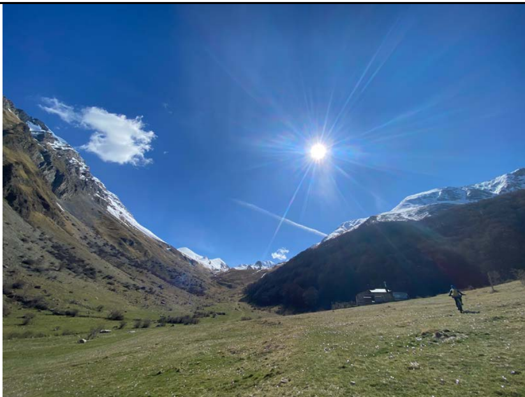
L'alta Valle del Chiarino e il Rifugio Fioretti