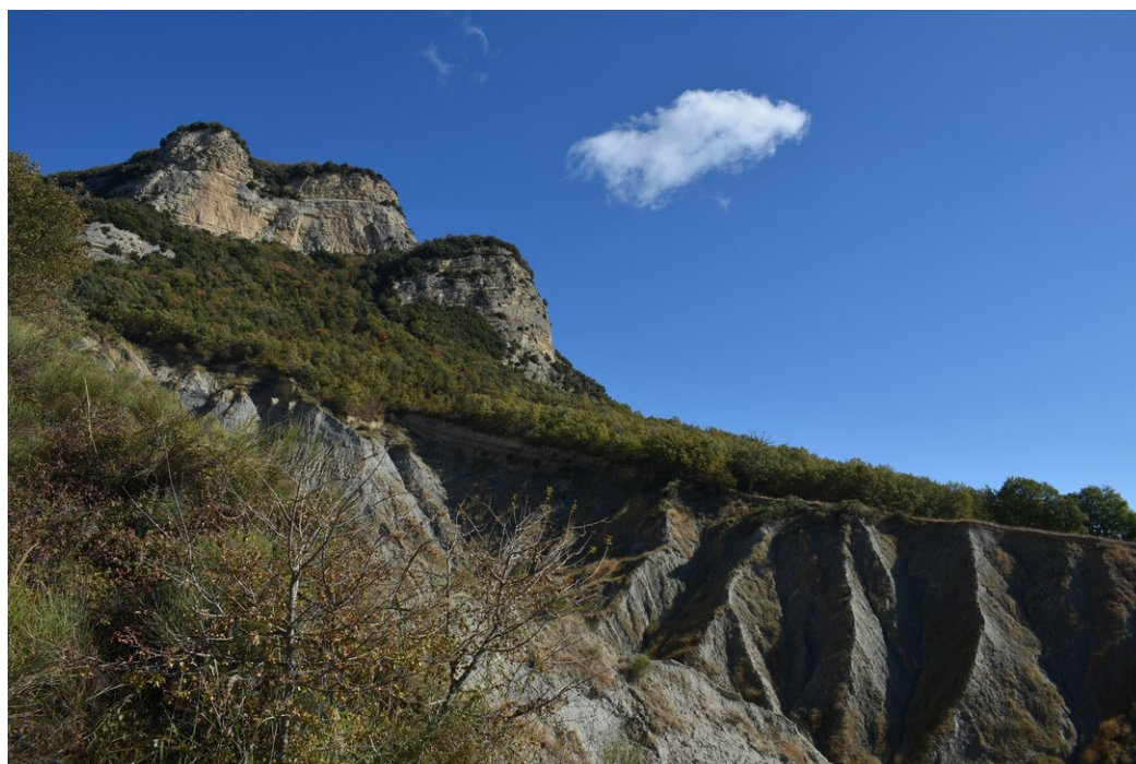
Monte Ascensione: Inconfondibile profilo