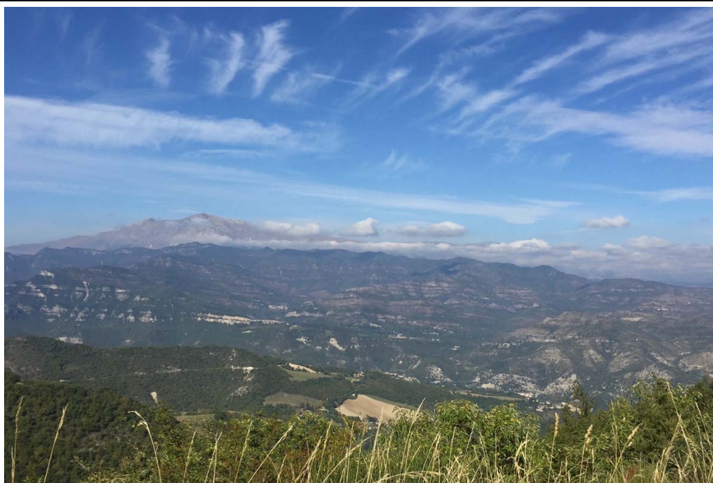
I Monti Sibillini da San Gregorio