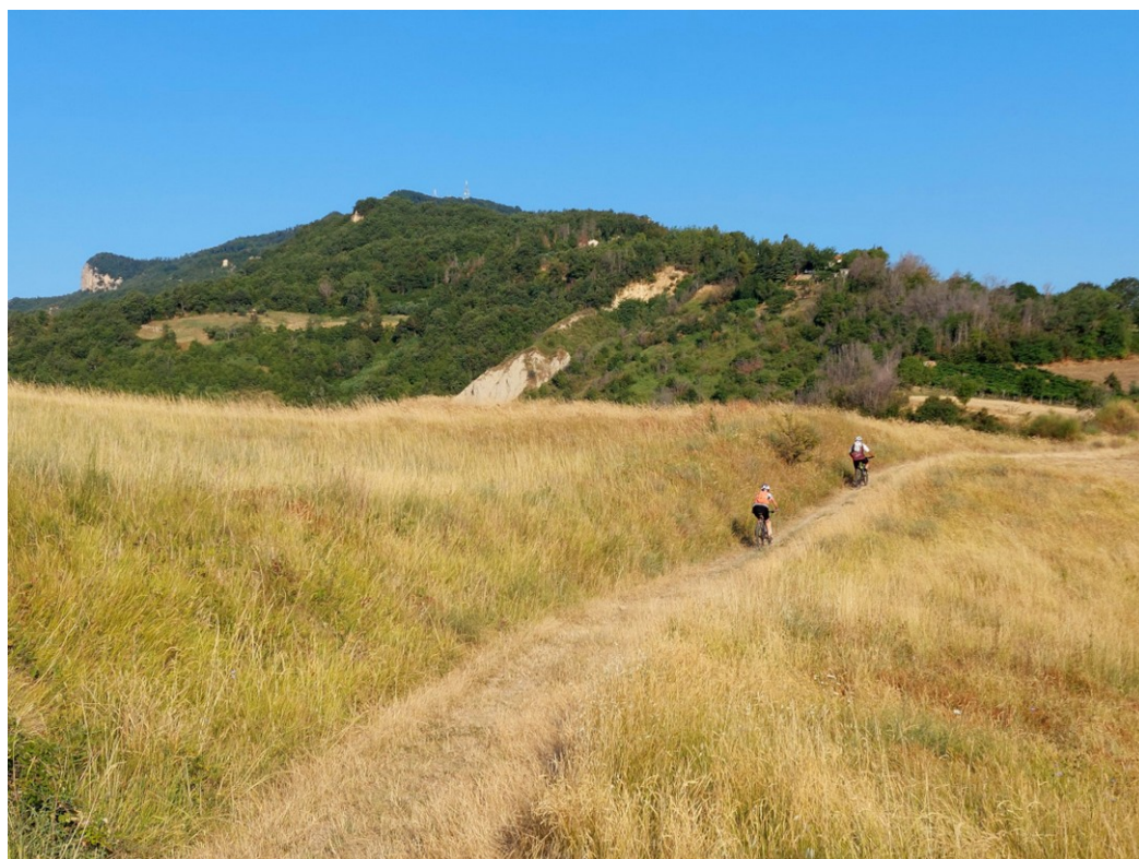
Monte Ascensione: salendo verso Capradosso