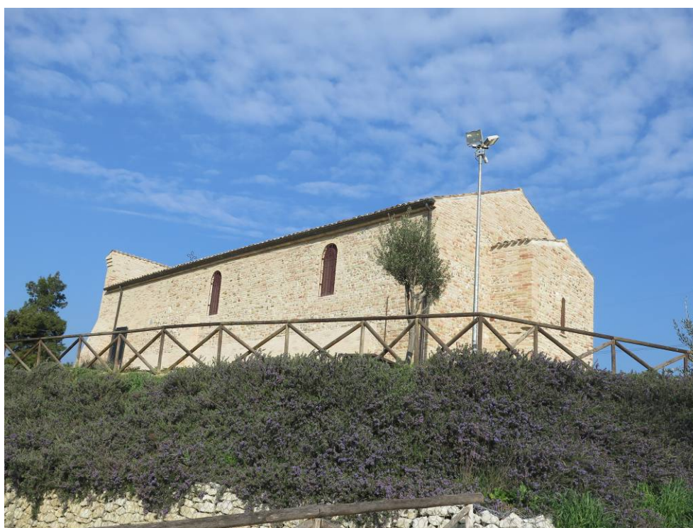
ABBAZIA SS. BENEDETTO E MAURO