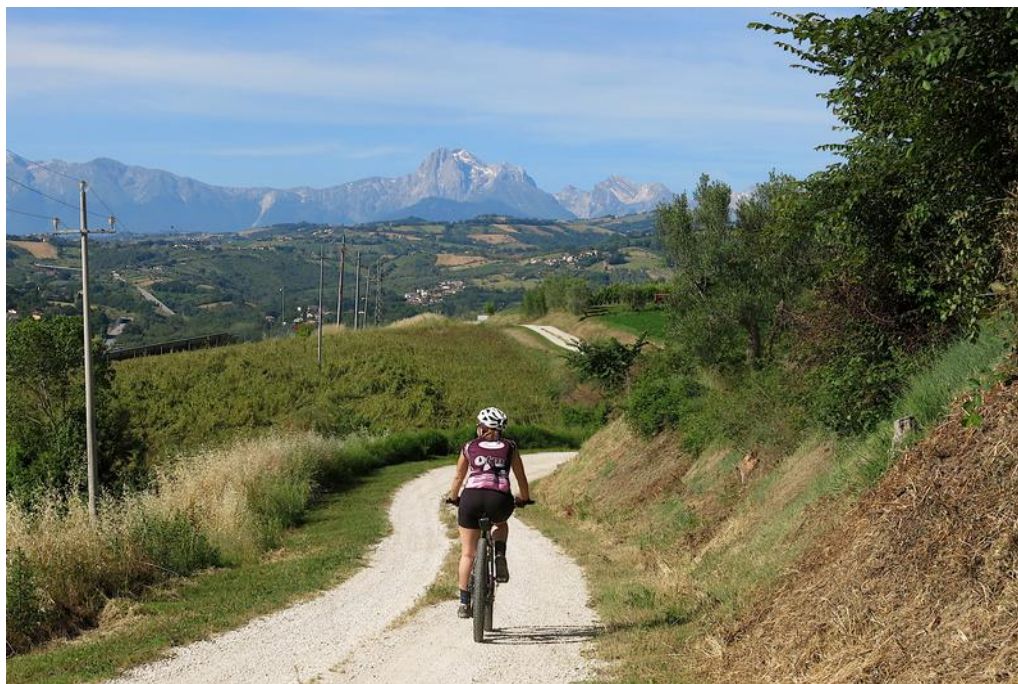
Avvicinamento a S. Onofrio con vista sul Gran Sasso.