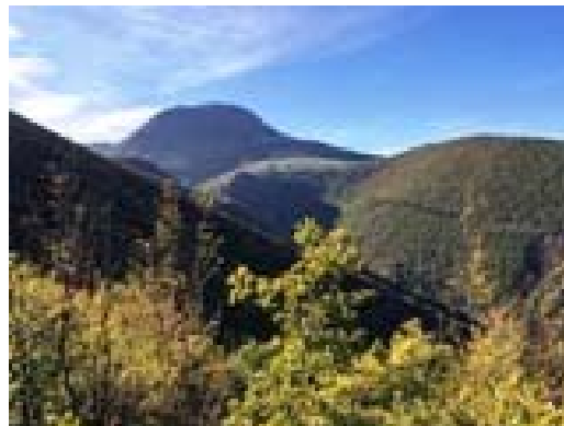
Il Monte San Vicino in autunno