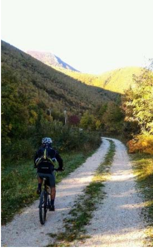
Salendo da Frontale verso Pian dell'Elmo