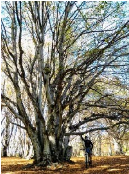
Faggeta di Canfaieto