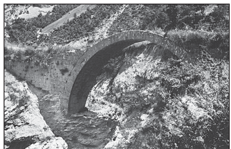
Il ponte di Tasso prima e dopo il restauro

Negli anni '30 il ponte di Tasso fu restaurato e consolidato dal Consorzio di bonifica del Tronto che rinforzò le spalle e realizzò a valle una briglia sul torrente.