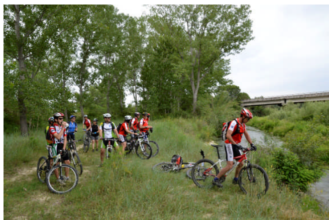
la ciclabile lungo gli argini del Fiume Tronto

Per ulteriori informazioni e per effettuare prenotazioni potete rivolgervi alla sede CAI ogni mercoledì e venerdì dalle ore 19 alle 20, telefonare allo stesso orario allo 0736 45158 oppure consultare il ns. sito www.slowbikeap.it