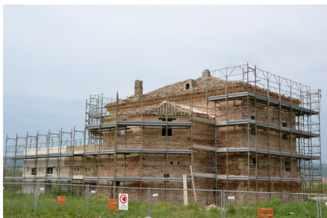
il Torrione di avvistamento del secolo XVI all’interno della Riserva Naturale Regionale della Sentina

Per questa iniziativa e per la guida “Salaria 4 regioni senza confini”, di prossima pubblicazione, che verrà presentata il 02 giugno al convegno di Rieti, si ringraziano in particolare il CAI Sede Centrale, gli Enti Territoriali (Comune e Provincia), la Camera di Commercio, la START, lo sponsor principale INDESIT S.p.A. e tutti i volontari che hanno permesso di raggiungere questo traguardo.